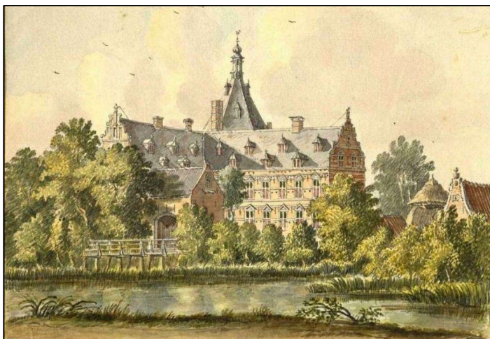
Kasteel Wolfwaard van de baronnen Pieck te Beesd